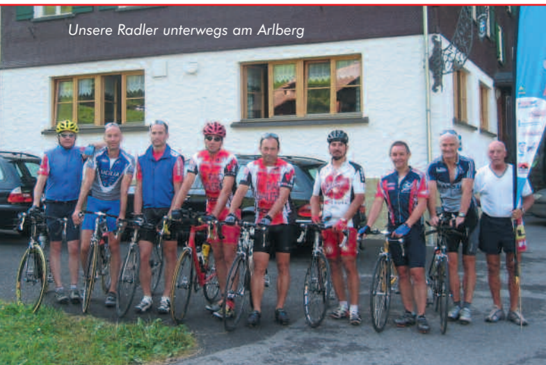
Unsere Radler unterwegs am Arlberg

Der Ski-Club veranstaltet den größten Teil seiner Kurse im skiclubeigenen Selbstversorgerhaus in Schröcken/Brengener Wald. Hierbei stehen nicht nur die jüngeren unerfahrenen Skilehrer manchmal vor einem Problem: Zu Hause kocht man nur für kleine Runden, jetzt will eine 40-köpfige Rasselbande ein schmackhaftes Essen auf dem Teller haben. Die Lösung für dieses Dilemma bot nun der vereinsinterne Kochkurs in der Schulküche der AOK Bruchsal. Unter fachkundiger Aufsicht zweier Diplom-Ernährungswissenschaftlerinnen wurde schnell, gut und reichlich gekocht. Nach neuestem ernährungswissenschaftlichem Stand wurde ein ausgewogener Speiseplan zusammengestellt, der die beste Mutter zu Hause ihren Sprössling mit gutem Gewissen dem Ski-Club anvertrauen lässt. Die Ski-Lehrer-Crew hatte nicht nur Spaß an dem vereinsinternen Kochduell, sondern ging auch wohl genährt nach Hause.