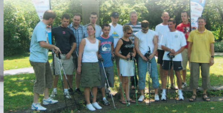
Nordic-Walking-Schulung unserer Übungsleiter